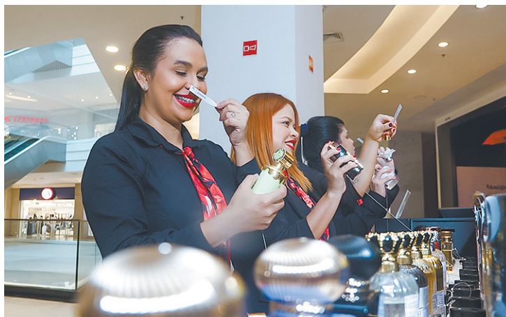
Buscas por perfumes árabes cresceram 24 vezes em apenas dois anos

mes de 100 ml, no vidro grande, de R$ 200 a R$ 300. Fora que as embalagens são lindas e as fragrâncias são diferentes, difícil não chamar a atenção com eles”, completa.